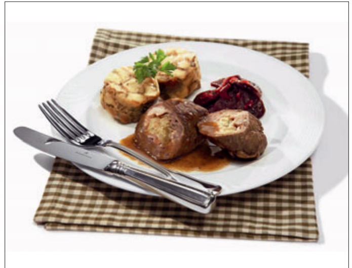
Traditionell gefüllte Rinderroulade, dazu Laugenknödel und Rotweinschmorsoße

Zum Abschluss seiner kulinarischen Reise durch die deutsche Küche lässt der Spitzenkoch in den Bordrestaurants der Deutschen Bahn bis Februar zwei echte Klassiker auftischen: Deftiger Linseneintopf und Laugenknödel zur traditionell gefüllten Rinderroulade. „Zu solch einem Knödel aus Laugenbäck gehört auch eine g'scheite Soße dazu“, meint der bayerische Sternekoch und kreiert in seinem Rezept eine schmackhaft gewürzte Rotweinschmorsoße zur Rinderroulade.