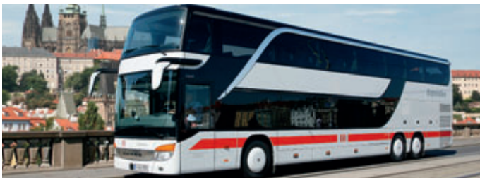
Der Expressbus von München nach Prag

Prag ist die Kongressstadt Osteuropas. Im Prager Kongress-Zentrum sowie in den First-Class-Hotels finden hochkarätige, internationale Veranstaltungen statt. Ab dem 11. Dezember 2011 bietet die Deutsche Bahn Geschäftsreisenden mit der neuen Expressbus-Verbindung zwischen München und Prag eine zeitsparende und komfortable Anreise. Der Expressbus fährt in nur 4¾ Stunden von München in die tschechische Hauptstadt und ist damit eine Stunde schneller als der Zug. Der Expressbus bringt die Gäste direkt an den Prager Hauptbahnhof und verkürzt so die Wege ins Stadtzentrum. Pro Tag werden vier Busverbindungen von und nach Prag angeboten, zwei davon halten auch am Münchner Flughafen. Der erste Bus ab München Hbf fährt um 7.50 Uhr und ist um 12.29 Uhr in Prag. Zurück geht es um 16.36 Uhr und Ankunft in München ist um 21.15 Uhr.