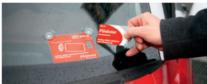
Die Fahrzeuge werden mittels einer Kundenkarte geöffnet

Weitere Informationen unter: www.flinkster.de